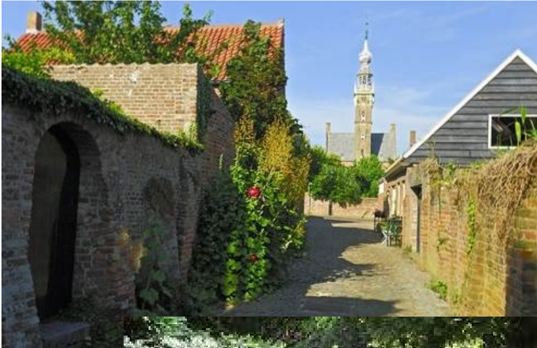
historische straatjes: hierboven en rechts de Simon Oomstraat