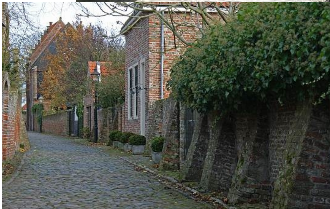
hierboven: de Stadhuisstraat