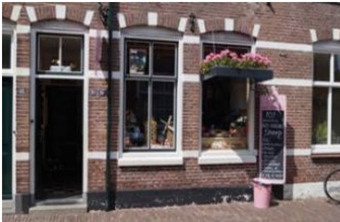
niet te missen: Oma's Snoepwinkeltje

Echter, ook wanneer er geen markt is heeft Veere genoeg winkeltjes om een streekproduct of een souvenirtje te kopen.