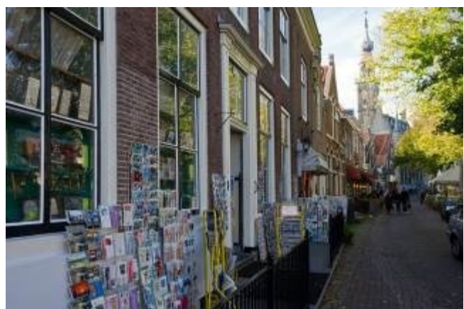
... en nog eens de Markt