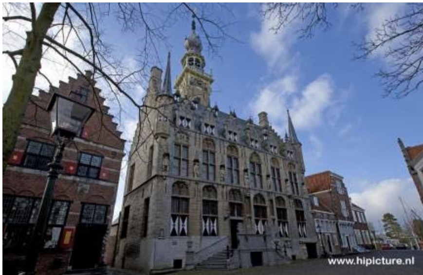
voorgevel stadhuis en oud huis (1579) naast het stadhuis

Het stadhuis behoort tot de top 100 der Nederlandse UNESCO-monumenten.